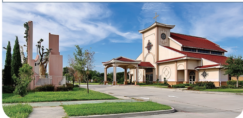
GIÁO XỨ ĐỨC MẸ LA VANG - WWW.LAVANGCHURCH.ORG